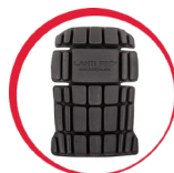
Ochraniacze kolan do spodni/ogrodniczek ochronnych

MATERIAŁ: 40% bawełna, 60% poliester, 270 g/m 2 . Pasy odblaskowe zgodne z normą EN ISO 20471. Wysoka klasa widzialności: klasa 2. Podwójne szwy. 12 kieszeni, w tym 9 zapinanych na rzep. Kieszenie na ochraniacze kolan. Regulacja w pasie za pomocą guzików i gumki. Szelki z regulacją długości za pomocą zapięcia i gumki. Napy pokryte tworzywem chroniącym przed kontaktem z wodą. Wszywka identyfikacyjna. Kieszeń na telefon komórkowy. Wzmocnione kieszenie materiałem (600D poliester) odpornym na przetarcia. Potrójne szwy. Oczko na klucze. Szlufka na młotek. NORMA: EN ISO 13688, EN ISO 20471.