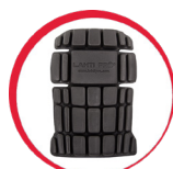
Ochraniacze kolan do spodni/ogrodniczek ochronnych

MATERIAŁ: 35% bawełna, 65% poliester. Wytrzymała tkanina typu CANVAS. 10 kieszeni, w tym 1 zamykana na suwak. Kieszeń na telefon komórkowy zabezpieczona tkaniną odbijającą promieniowanie elektromagnetyczne. Wstawki z materiału stretch „4-way elastic” (rozciągliwość w 4 kierunkach) zapewniają elastyczność i wygodę podczas użytkowania. Wentylacja z siatki w zgięciu kolan. Wstawki odblaskowe zwiększające bezpieczeństwo podczas pracy. Potrójne szwy. Dodatkowe wzmocnienie szwów w kroku. Innowacyjna regulacja szerokości w pasie za pomocą specjalnej konstrukcji z elastyczną taśmą. Oczko na klucze. Szlufka na młotek. Szelki z regulacją długości. Wzmocnione kieszenie, kieszenie na ochraniacze kolan, plecy oraz dół spodni materiałem (500D poliester) odpornym na przetarcia. Krój „slim fit”. Modny i ciekawy design. Wszywka identyfikacyjna. NORMA: EN ISO 13688.